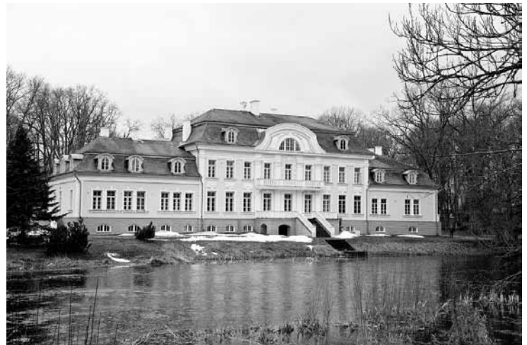
Laupa mõis.