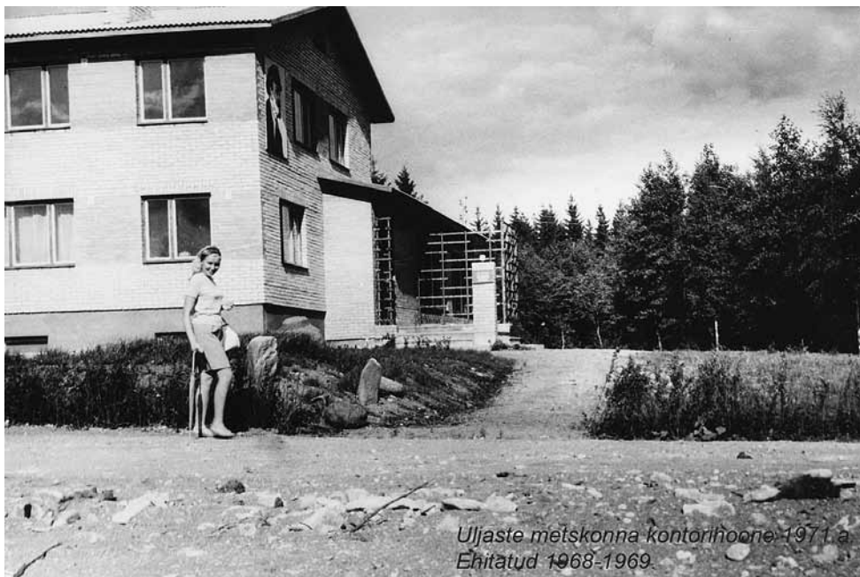
Uljaste metskonna kontorihoone. 1971 a. Ehitatud 1968-1969.