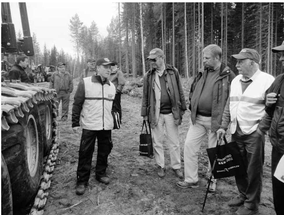
Euroopa metsaseltside esindajad Finnmetko metsandusnäitusel.

Saksamaal on pikaajased puitehituse traditsioonid, vanim tamme konstruktsiooniga puitmaja pärineb aastast 1276. Aastas rajatakse umbes 25 000 hoonet, mille puitkonstruktsioonides kasutatakse